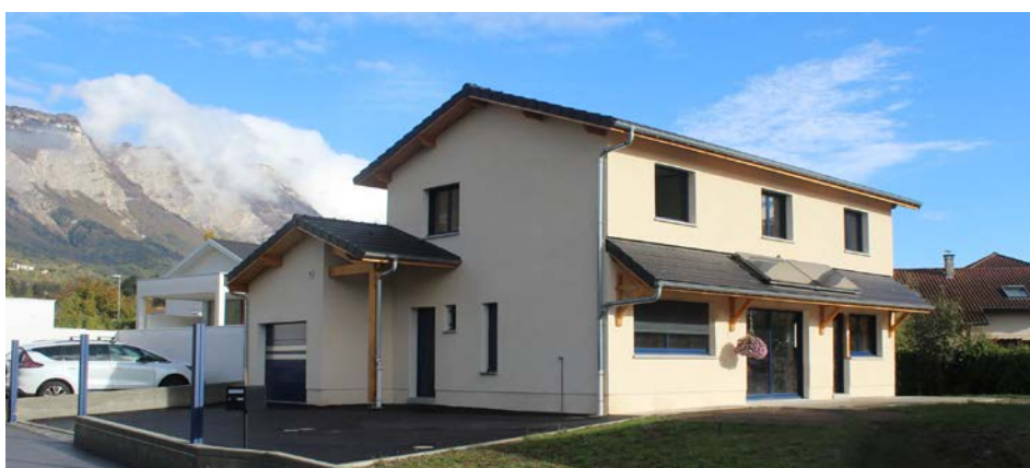
Villa ossature bois – Meylan (38)

depuis 2010 ARCHITECTE LIBERAL à Gap (05)