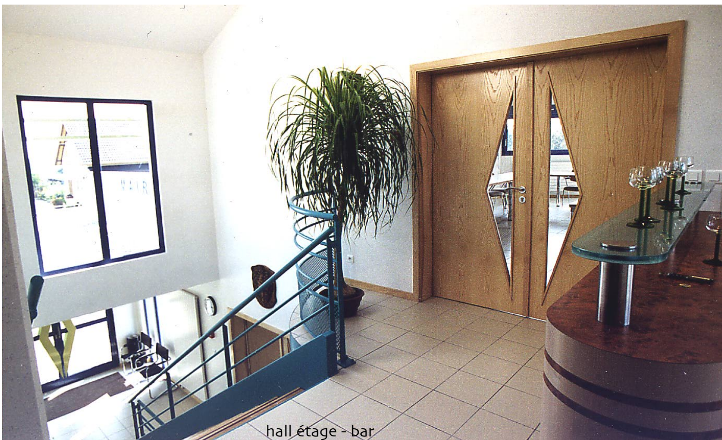
hall étage - bar