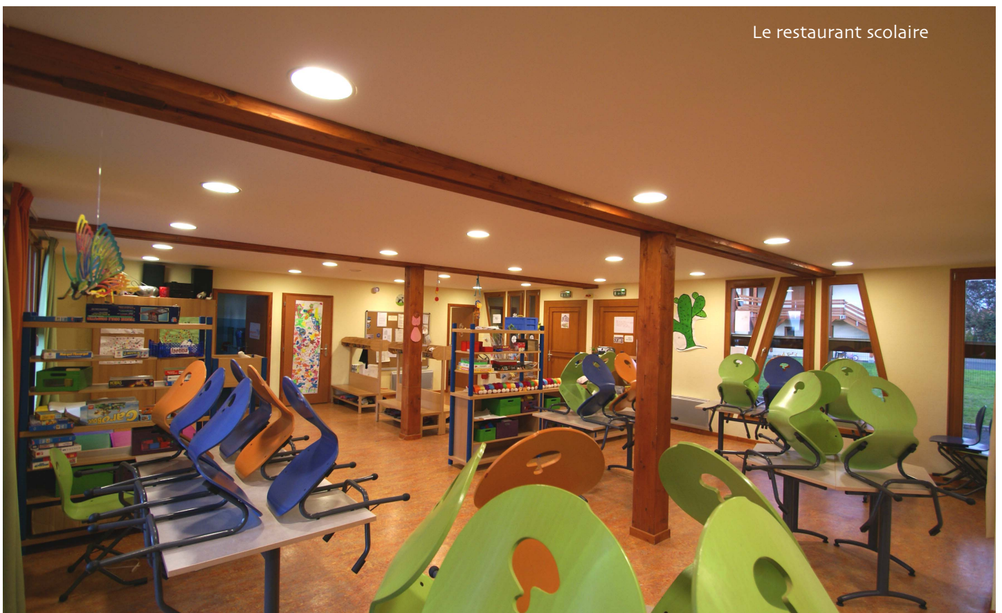
Le restaurant scolaire