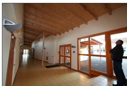
le hall d'entrée