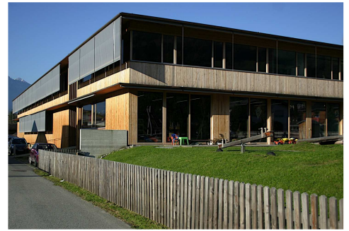
centre communal passif de Ludesch