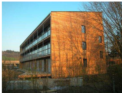
Siège administratif de Marché International Kempththal

15h00 visite de l' entreprise bois Lignatur à Waldstatt