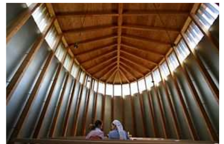
chapelle de Sogn Benedegt