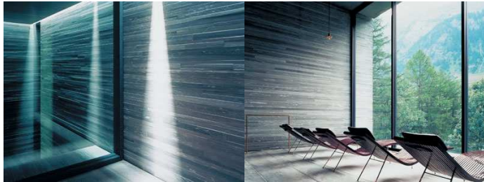
Therme de Vals

22h30-24h00 bains de nuit dans les thermes