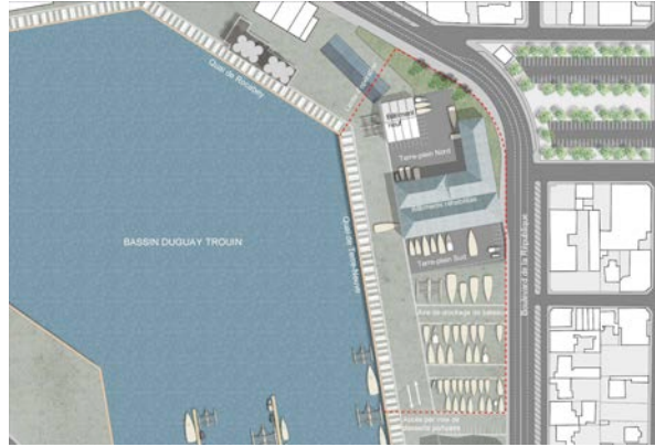
Pôle technique Duguay Trouin à Saint-Malo – Jean-François Revert