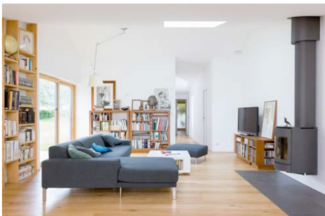
Maison C à Quimper – Véronique Stephan