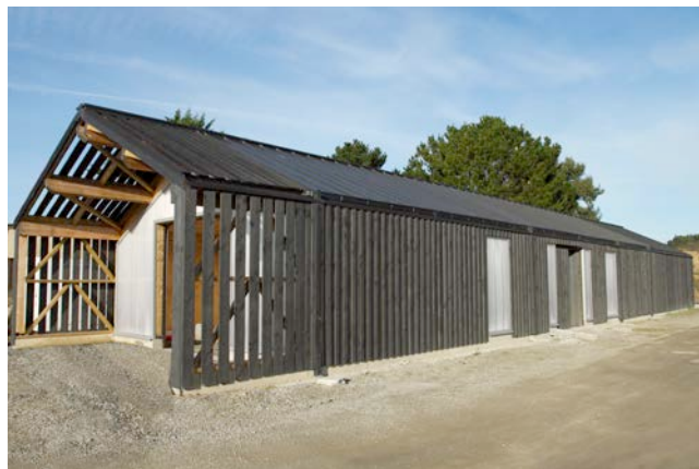
Chantier ostréicole à Sarzeau – Horizon Vertical © Kizzy Sokombe