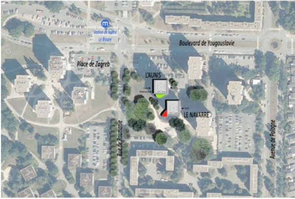
Aunis et Navarre à Rennes – Latitude