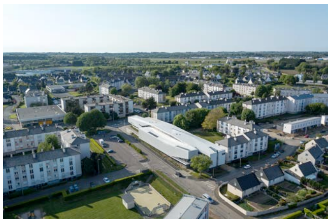
Maison Emploi et Formation professionnelle à Lannion – Atelier Arcau