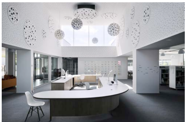
Médiathèque F. Mitterrand à Le Relecq-Kerhuon – DDL Architectes