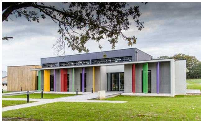
Le Reso - Pôle Emploi et services à Guichen – Atelier CUB3