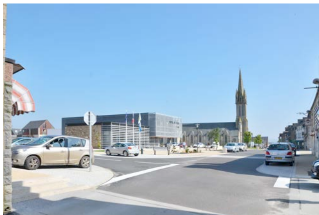
Mairie de Plouigneau – Alain Le Scour