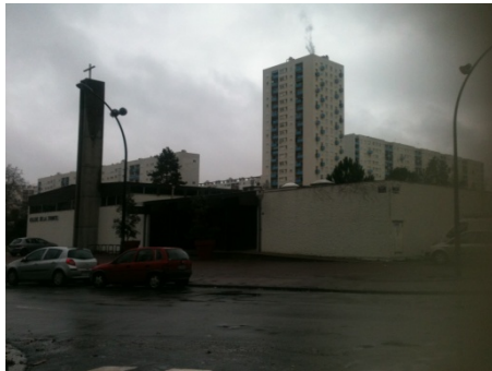
Eglise Grand-parc ( 1968 )