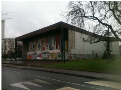
salle des fêtes

16H30 : Rencontre avec C. Hutin : projet en cours de la salle des fêtes et logements de l'équipe Lacathon-Vassal. ( 30mn )