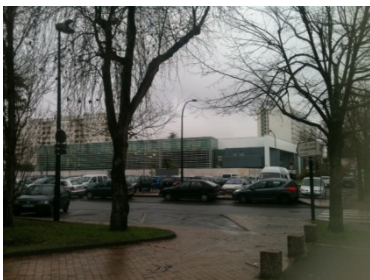
piscine Gd-parc ( Agence Touton-Teisseire)

16H15 : Passage sur les logements en face , conçu par la même équipe d'Architecte, vu sur l'ensemble de la cité du grand parc : ( petit discours sur le grand parc.)