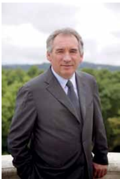
François Bayrou — Maire de Pau — Président de la Communauté d'agglomération Pau Béarn Pyrénées

Pour parler de ces sujets, nous avons fait appel aux meilleurs experts. Des tables rondes associant des acteurs locaux permettront de faire avancer notre projet pour l'agglomération. Des visites et des moments plus festifs viendront nourrir les échanges. Je vous souhaite à tous une excellente semaine, riche de découvertes et de nouvelles pistes de travail.