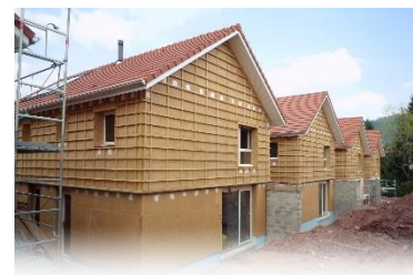
Maisons de la Corvée à Nancy