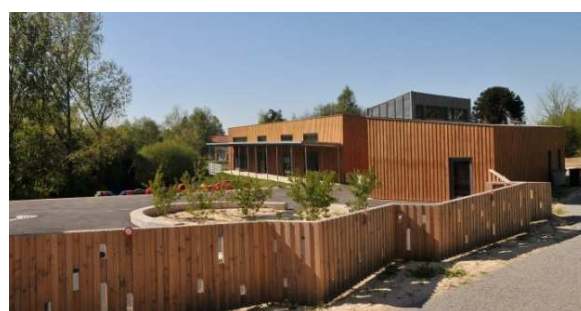
École Maternelle Pierre Charissou à Châlus (87) 1er Prix Catégorie bâtiments et équipements publics de l'édition précédente.

La participation au Palmarès Limousin de la Construction Bois est gratuite et nécessite uniquement de saisir un projet via le formulaire d'inscription du Prix National qui a évolué pour une meilleure ergonomie et qui mutualise les inscriptions aux deux concours : RÉGIONAL et NATIONAL. Le jury, composé de partenaires régionaux et nationaux du secteur de l'architecture et du bâtiment, se réunira pour désigner les lauréats (prix par catégorie et mentions).