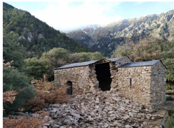
Fig. 5. Vista del campanar després de l'ensorrament.

Finalment, l'any 2020, després de l'ensulsiada del campanar, el mateix Departament ha redactat i executat un projecte de desenrunament selectiu que, entre altres coses, permet identificar fins a 441 pedres, una xifra que, a falta d'un recompte general, es pot aproximar a la meitat del total del parament exterior del campanar.