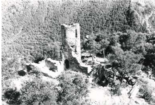
Fig. 2. Vista de l'església a inicis del segle XX.

L'any 1982 es va dur a terme la reconstrucció, consistent en l'aixecament dels murs de la nau i l'absis i la construcció de la coberta d'aquests dos elements i del campanar.