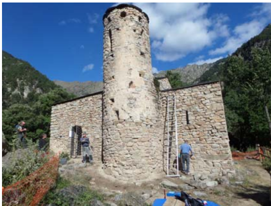
Fig. 4. Vista del campanar durant la intervenció de l'any 2016.

L'any 2016 els serveis tècnics del Departament de Patrimoni Cultural van dur a terme una operació de manteniment preventiu periòdic de l'església, en què van impermeabilitzar les cobertes de la nau i l'absis, van desvegetalitzar químicament els murs i els van reposar, i van reparar, per percussió, el moviment en lliscament de part dels carreus de la base de la torre.