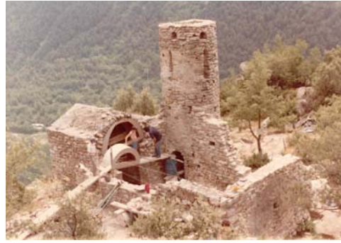
Fig. 3. Vista de l'església durant la reconstrucció..

L'any 2016 els serveis tècnics del Departament de Patrimoni Cultural van dur a terme una operació de manteniment preventiu periòdic de l'església, en què van impermeabilitzar les cobertes de la nau i l'absis, van desvegetalitzar químicament els murs i els van reposar, i van reparar, per percussió, el moviment en lliscament de part dels carreus de la base de la torre.