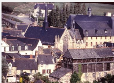
Dans le quartier du Rachapt le Monastère Saint-Nicolas