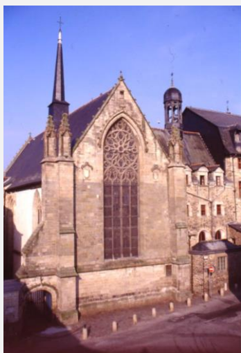
La Chapelle Saint-Nicolas

En haut à droite Monastère Saint-Nicolas L'entrée du cloître