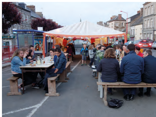
Habiter Valdallière, Valdallière 2018