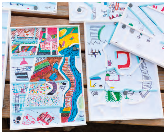
Jeux de terrains, Nantes, 2018

Afin de permettre à tous de suivre le déroulement des résidences, chaque binôme créera et alimentera un site/blog dédié à la résidence et produira une courte vidéo présentant leur démarche et leurs réalisations.