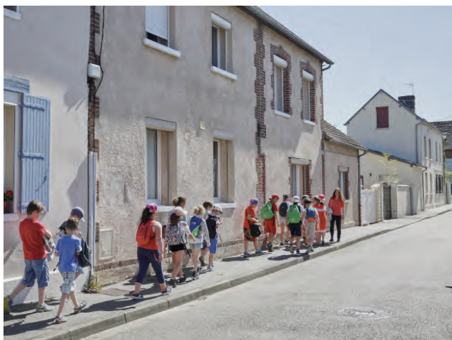
Fort Fantôme, Pont de l'Arche, 2018