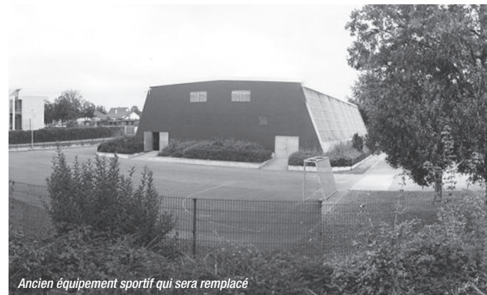
Ancien équipement sportif qui sera remplacé

Si à première vue le projet peut sembler massif et fermé, il s'avère en réalité assez aérien et ouvert. Le traitement du rez-de-chaussée – offrant un hall, une circulation aisée et un foyer, du premier étage – avec ses tribunes, sa salle de réunion et sa salle polyvalente, et du deuxième étage – proposant une salle de tir à l'arc et de tennis de table, intro-